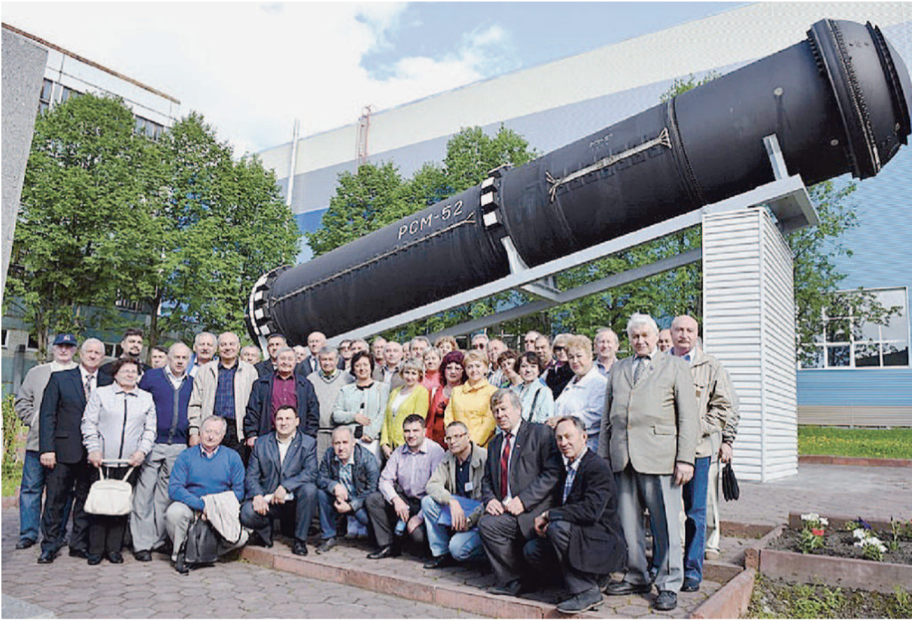
ФОТО НА ПАМЯТЬ. Участники отраслевого семинара у макета ракеты РСМ-52.