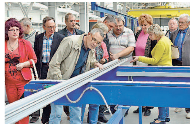
На производстве алюминиевого профиля.