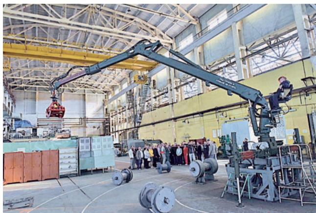
Гостям демонстрируют работу ТЗМ.