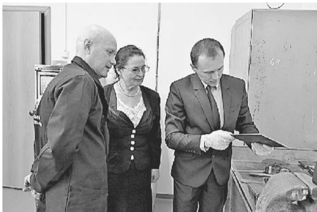
ГЛАВНОЕ — КАЧЕСТВО! Жюри конкурса оценивало выполненную работу.