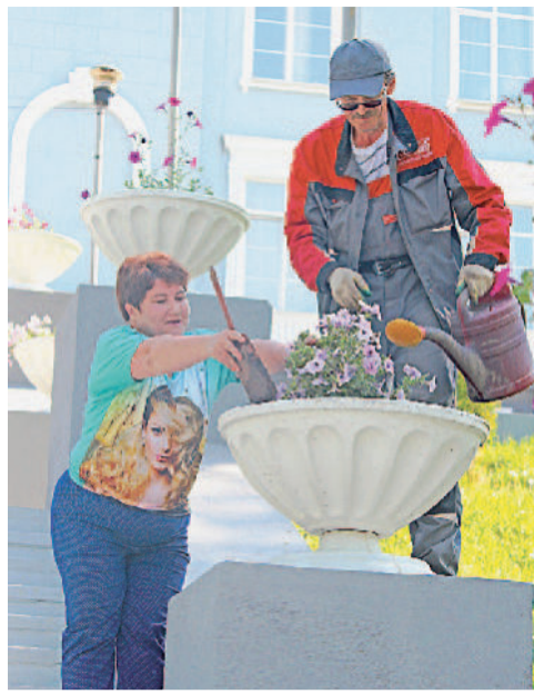
ЧТОБ ЦВЕЛО! У Дворца Победы высадили петунии.

Вся эта красота не появилась по мановению волшебной палочки. Сотрудники отдела № 505 заблаговременно подготовили и установили вазоны, добавили переносной и удобрение, высадили растения. Теперь необходимо регулярно их поливать. В летний сезон работа предстоит большая: косить газо-