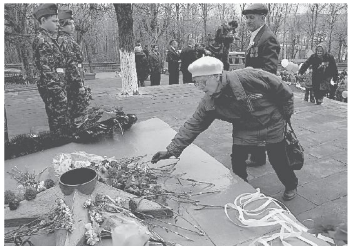
Несут к Обелиску цветы. Так будет и нынче.

Дорогие заводчане! Уважаемые ветераны! Сердечно поздравляем Вас с Днем Великой Победы!