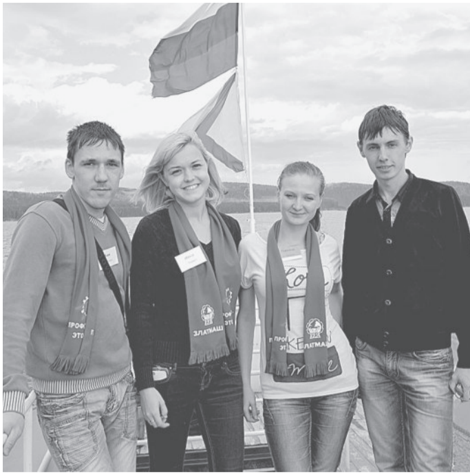
На снимке: участники семинара молодежных профсоюзных лидеров.